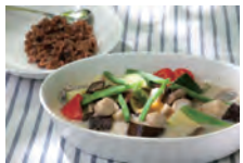
グリーンカレーと酵素玄米