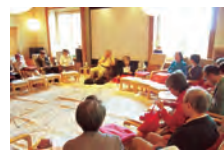
何でもご質問下さい