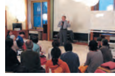
わかりやすい講義