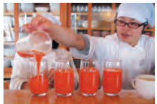
名物にんじんジュース