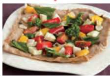
お野菜たっぷりそばガレット