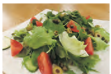
朝採り一番新鮮サラダ