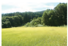
お米も無農薬で育てます

1日目 11:30 乗合タクシー長野駅東口発 12:00 受付開始 13:00 初エントランス・自己紹介 16:00 入浴・温泉 18:00 夕食(特製健康養生食) 19:00 帯津先生講義I 生老病死のホメオパシー 講師:帯津良一 20:00 帯津先生「ホメオパシー講演①」ビデオ学習 21:30 座禅・セラピータイム 2日目 9:00 帯津良一先生指導 樹林気功「時空」 10:00 朝食(特製健康養生食) 11:00 帯津先生講義II 生老病死のホメオパシー 車座なんでも相談Q&A 1回目 講師:帯津良一、ファシリテーター:塩澤みどり 14:00 ホメオパシー個人カウンセリング(希望者のみ:別途料金) 14:00 ティータイム 16:00 入浴・温泉 天然温泉天狗の館 18:00 夕食(特製健康養生食) 20:00 帯津先生「ホメオパシー講演②」ビデオ学習 21:30 座禅・セラピータイム 3日目 9:00 帯津良一先生指導 樹林気功「時空」