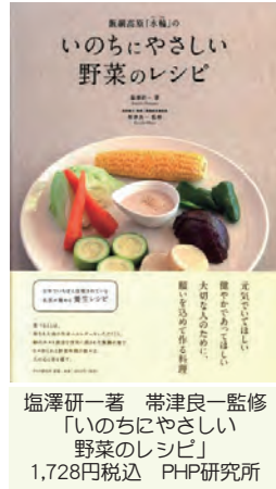
塩澤研一著 常津良一監修 「いのちにやさしい野菜のレシピ」 1,728円税込 PHP研究所