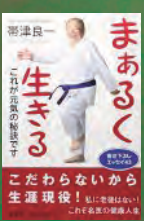
帯津良一著 海竜社