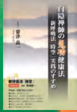
帯津良一著 佼成出版社