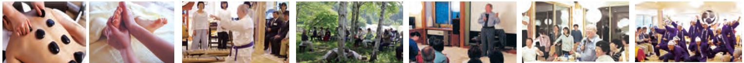
セラピーでのんびり 帯津先生の気功演舞 帯津先生と気功三昧 帯津先生に何でも質問OK 笑顔あふれる懇親会 感動を呼び本気のソラソラ節