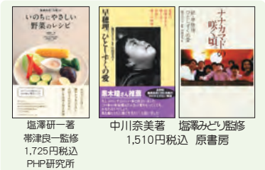
塩澤研一著 帯津良一監修 1,725円税込 PHP研究所 中川奈美著 塩澤みどり監修 1,510円税込 原書房

いのちの森の大自然のエネルギーは、心と体を癒し、自然治癒力を高めます。隣接する水輪ナチュラルファーム自然農園では農薬や化学肥料を一切使用せずお野菜を作り、環境と健康に配慮した農法を行っています。大切に保護された自然は、やどりぎや銀竜草など高山植物、また山野草の宝庫です。館内寝具類は清潔を保ち、施設には和紙の照明、建物は天然木の檜や杉材を使用することで、人工的な建材によって遮断されることなく大自然のもつ澄んだ空気を、存分に味わうことができます。厳選された無添加の食材・調味料、無農薬野菜などを使った心こもった美味しい食事は心身をリフレッシュしてくれます。