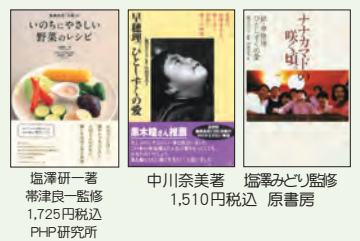
塩澤研一著 帯津良一監修 1,725円税込 PHP研究所 中川奈美著 塩澤みどり監修 1,510円税込 原書房

いのちの森の大自然のエネルギーは、心と体を癒し、自然治癒力を高めます。隣接する水輪ナチュラルファーム自然農園では農薬や化学肥料を一切使用せずお野菜を作り、環境と健康に配慮した農法を行っています。大切に保護された自然は、やどりぎや銀竜草など高山植物、また山野草の宝庫です。館内寝具類は清潔を保ち、施設には和紙の照明、建物は天然木の檜や杉材を使用することで、人工的な建材によって遮断されることなく大自然のもつ澄んだ空気を、存分に味わうことができます。厳選された無添加の食材・調味料、無農薬野菜などを使った心こもった美味しい食事は心身をリフレッシュしてくれます。