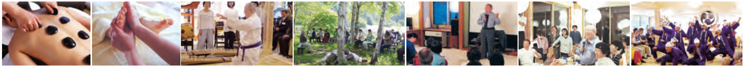
セラピーでのんびり 帯津先生の気功演舞 帯津先生と気功三味 帯津先生に何でも質問OK 笑顔あふれる懇親会 感動を呼ぶ本気のソーラン節

18:00～ 特製健康養生食(夕食) ⑰食と心の話：塩澤研一 19:30～ ⑱セラピータイム 【5日目】 (癒しのリラックスタイム②) 8:30～ ⑲気功(飛田航介) 9:00～ ⑳朝リラックスヨガ 10:00～ 特製健康養生食(朝食) (健康野草茶1杯付) 11:00～ ㉑こけ玉教室(植物とふれあいタイム・こけ玉はおみやげにどうぞ(無料)) (4泊参加の方は 12:00解散、12:10 乗合タクシー出発) 12:30～ ㉒リラックスフリータイム 13:30～ ティータイム(おやつ・ドリンク付き) 14:30～ ㉓酵素玄米講習 食の話 16:00～ 入浴 18:00～ 夕食 ㉔安心できる心の持ち方：塩澤研一 20:00～ セラピータイム 【6日目】 (癒しのリラックスタイム③) 8:30～ ㉕気功(飛田航介) 9:00～ ㉖朝リラックスヨガ 10:00～ 特製健康養生食(朝食) (人参ジュース1杯付) 11:00～ ㉗リラックスフリータイム 12:00～ 解散 ※車座交流会では椅子もご用意出来ます。