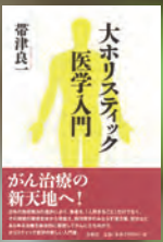
帯津良一著 春秋社