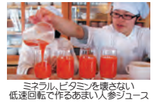
ミネラル、ビタミンを壊さない低速回転で作るあまい人参ジュース

大自然の中でゆったりと過ごし、無農薬野菜料理、人参ジュース(1杯650円相当)、気功、足裏リフレクソロジー1回(3,000円相当が無料)付のセット。酵素玄米講習有。心の持ち方勉強会も人気。徹底的に自然治癒力を上げる長期療養滞在コース。