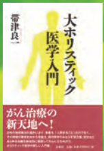
帯津良一著 春秋社