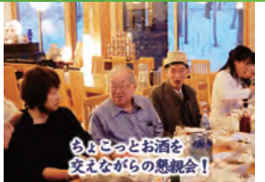
ちよこっとお酒を交えながらの懇親会!