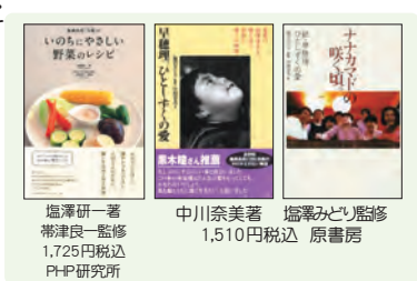
塩澤研一著 帯津良一監修 1,725円税込 PHP研究所 中川奈美著 塩澤みどり監修 1,510円税込 原書房

会場：いのちの森水輪 いのちの森の大自然のエネルギーは、心と体を癒し、自然治癒力を高めます。隣接する水輪ナチュラルファーム自然農園では農薬や化学肥料を一切使用せずお野菜を作り、環境と健康に配慮した農法を行っています。大切に保護された自然は、やどりぎや銀竜草など高山植物、また山野草の宝庫です。館内寝具類は清潔を保ち、施設には和紙の照明、建物は天然木の檜や杉材を使用することで、人工的な建材によって遮断されることなく大自然のもつ澄んだ空気を、存分に味わうことができます。厳選された無添加の食材・調味料、無農薬野菜などを使った心にも美味しい食事は心身をリフレッシュしてくれます。