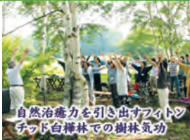
自然治癒力を引き出すアイトンチッド白樺林での樹林気功