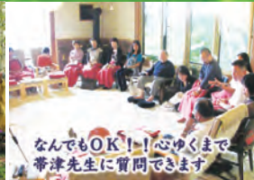
なんでもOK!心ゆくまで帯津先生に質問できます